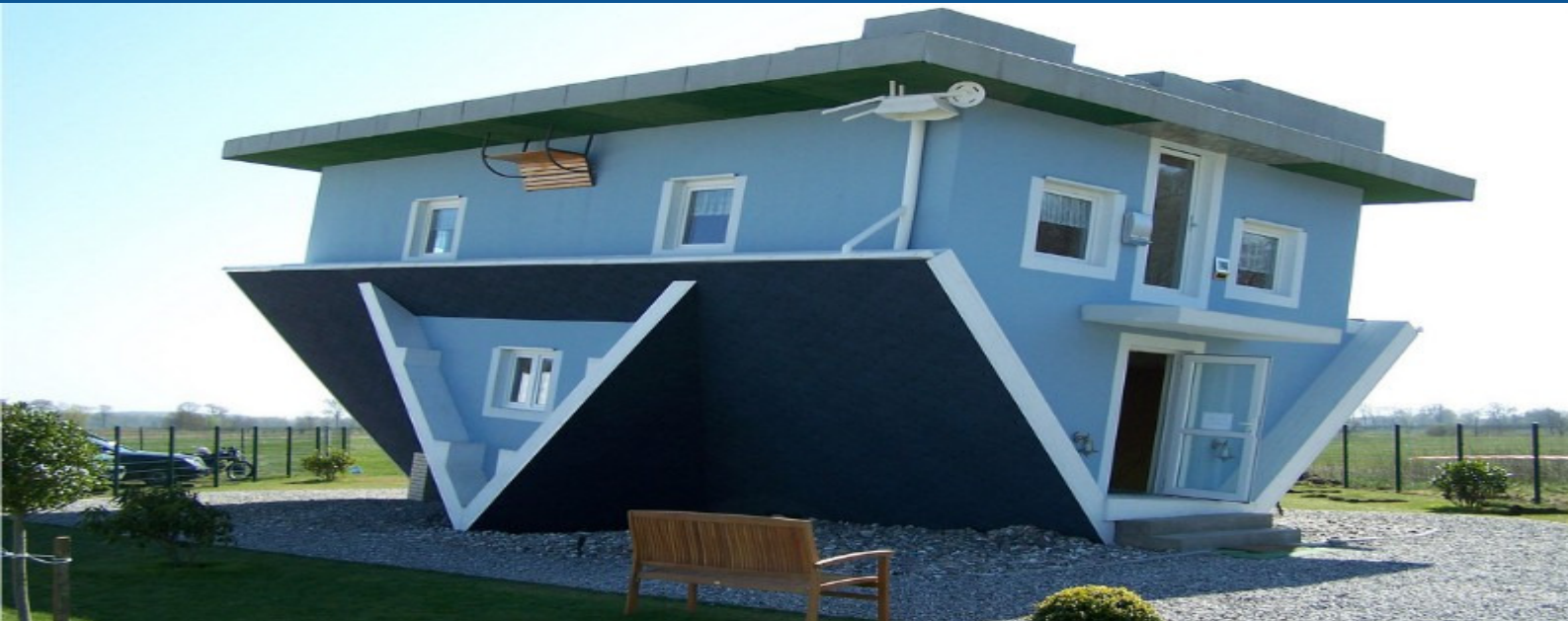
Anderer Blickwinkel, neue Perspektiven.